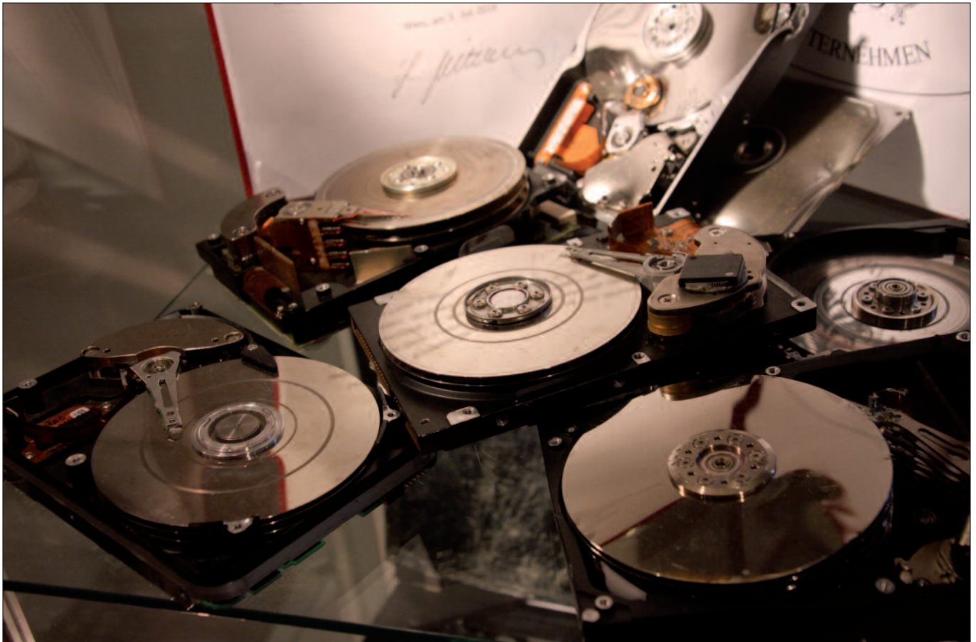
Festplatten nach Headcrash: Das Auslesen der Daten ist möglich.