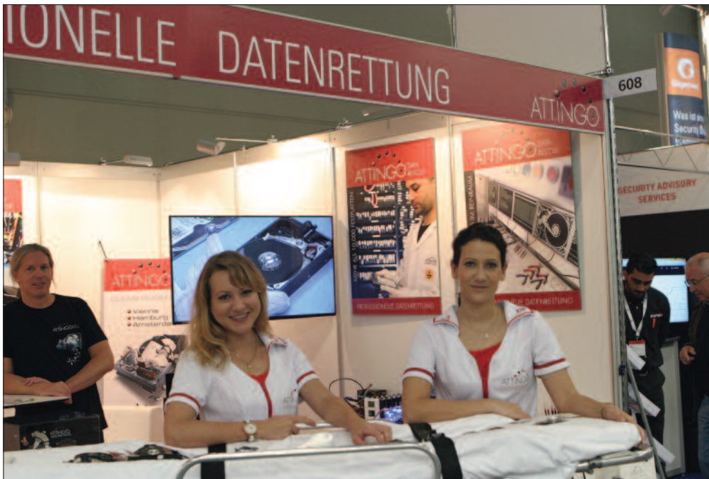
it-sa in Nürnberg: Stand der auf Datenrettung spezialisierten Firma Attingo aus Wien.

Administrator-Software installiert, die Passwörter von lokalen Administratoren geknackt und initiale Infektionsspuren entfernt. In weiterer Folge wurde der Mailverkehr überwacht, um weitere Passwörter und vertrauliche Informationen zu erhalten und um erkennen zu können, ob der Kompromittierung auf die Spur gekommen wurde. Die Administrator-Arbeitsplätze wurden überwacht, um Gegenmaßnahmen vorgereifen zu können. Mit Administrator-Accounts wurden Mails versendet, um eventuell verdächtige Handlungen als legitim zu tarnen.