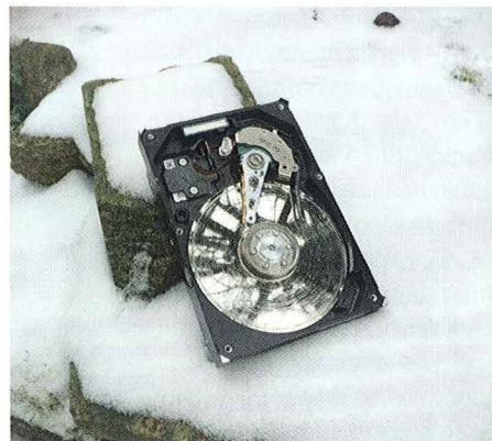
Elektronische Geräte mindestens zwei Stunden akklimatisieren lassen, bevor diese wieder in Betrieb genommen werden

Generell empfiehlt Attingo elektronische Geräte mindestens zwei Stunden