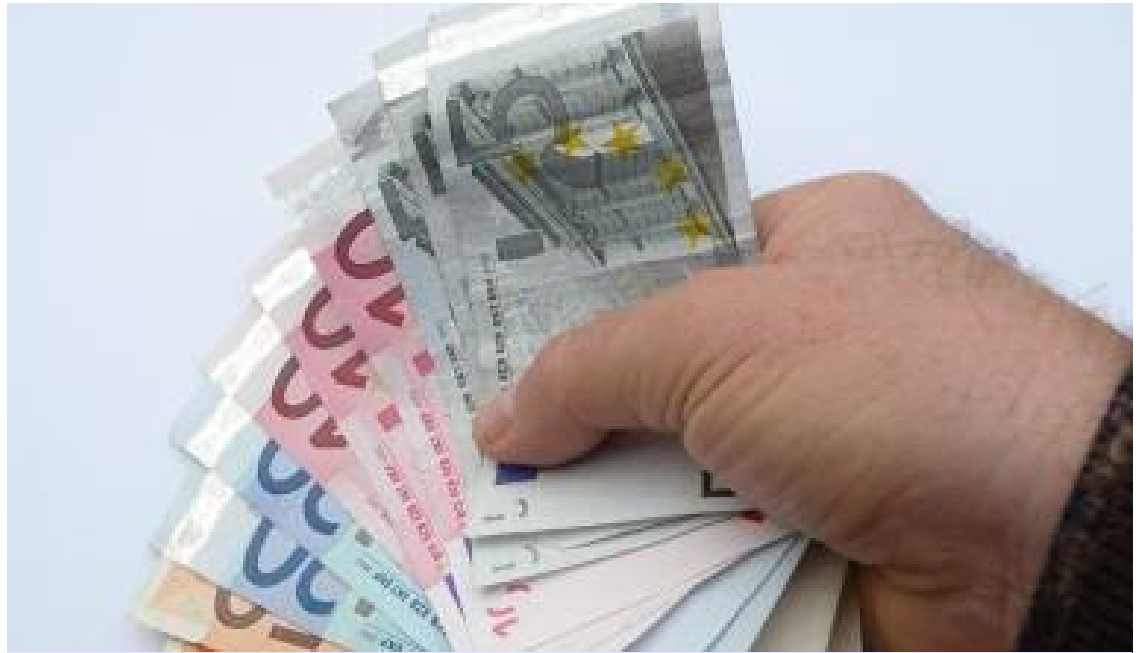
Bei den online gehandelten Beträgen handelt es sich in den meisten Fällen um kleinere Summen im Bereich der Klein- und Verbraucherkredite.

Kapitalsuchende werden von der Plattform in Bonitätsstufen von "A" bis "H" klassifiziert, an denen sich Kreditgeber orientieren können. Ihr Risiko bleibt durch das Sam-