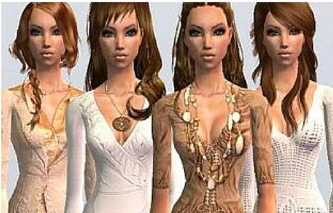
Alte Ideen neu verpackt: Avatare als virtuelle Darstellung der Kunden sollen sich besonders für Händler als Lösung anbieten. Das meinen zumindest einige Marketing-Experten selbstsicher.

Der Avatar ermögliche sogar das Ausprobieren eines T-Shirts oder der Blick in den Spiegel vor der Bestellung, um die Ware zu prüfen. "Je nach Vorlieben der Käufer werden die Verkäufer das Angebot auch in ihren realen Geschäften ausrichten."