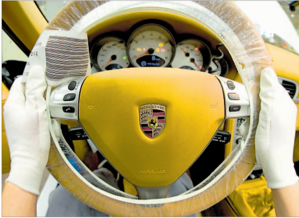
VW möchte schnellstmöglich das Lenkrad bei Porsche in die Hand nehmen. Im Tagesgeschäft ist die Kooperation längst angelaufen, die formale Verschmelzung verzögert sich.

Die Stuttgarter hatten sich mit schwer durchschaubaren Aktiengeschäften 2008 die Mehrheit an VW gesichert und dabei erdrutschartige Aktienkursbewegungen ausgelöst. Deshalb kämpft Porsche derzeit juristisch an mehreren Fronten. In den USA hat eine Gruppe von Investmentfonds wegen angeblicher Falschinformationen und Marktmanipulation gegen die Schwaben geklagt. Es geht um mehrere Milliarden US-Dollar Schadenersatz. Im Januar will das Gericht entscheiden, ob es die Klage zulässt. Sollte dies der Fall sein, droht Porsche ein jahrelanger Rechtsstreit. Auch in Deutschland ermittelt die Staatsanwaltschaft wegen des Ver-