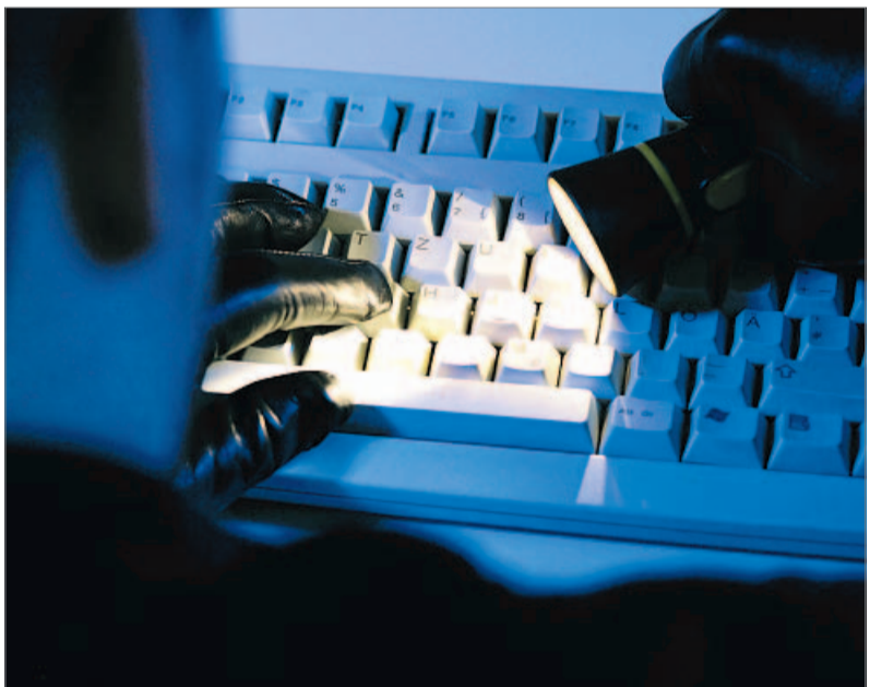
Die Computerkriminalität ist in den letzten Jahren weiter angestiegen. Mittlerweile gibt es sogar ganze Trojanerbausätze im Internet.

Klagen verzögern Eingliederung des Sportwagenherstellers